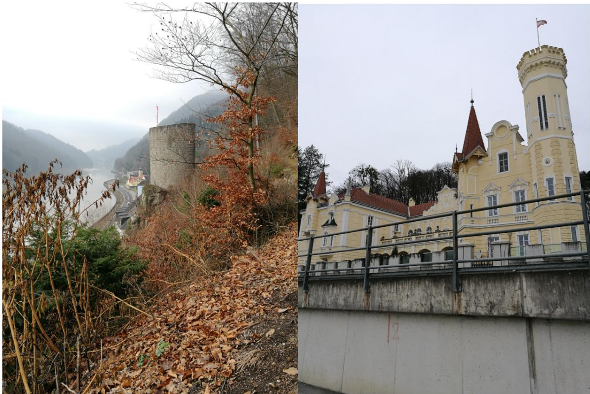
Der ehemalige Mautturm in Sarmingstein und das Strindbergsschlößl in Dornach

Maximal 9 Personen plus 3 stromerfahrene Bootsmänner!